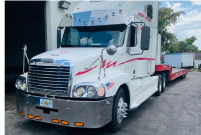
Midtown Towing of Miami, Inc.

La modernización de los sistemas y locales unidos a la revitalización de flota y la adquisición de nuevos equipos de última generación nos permitirá alcanzar nuestra Misión de: Ser la Empresa No 1 de contrato por la policía en el área de maniobra.