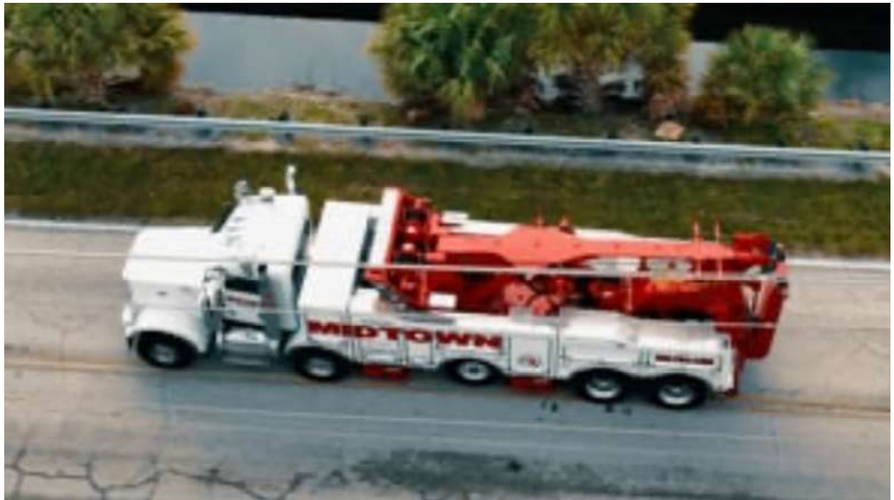
Midtown Towing of Miami, Inc.

La modernización de los sistemas y locales unidos a la revitalización de flota y la adquisición de nuevos equipos de última generación nos permitirá alcanzar nuestra Misión de: Ser la Empresa No 1 de contrato por la policía en el área de maniobra.