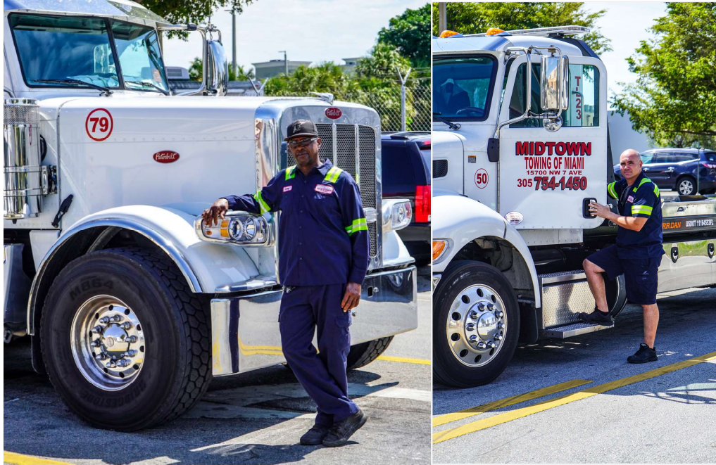
Trabajadores de Midtown Towing of Miami

Cuando la ciudad de Miami fue azotada por un ciclón , ocurrió un evento inesperado donde los residentes del pueblo de Coral Gables quedaron atrapados por árboles caídos. Midtown Towing of Miami, Inc. acudió de inmediato al lugar de los hechos con su equipo pesado para retirar los árboles que bloqueaban la residencia.