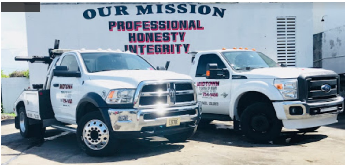
Midtown Towing of Miami, Inc.