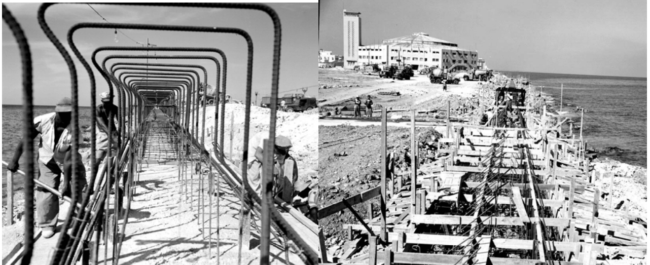
Ampliación del Malecón habanero, al fondo "Palacio de Convenciones y Deportes"

Este sitio tan pintoresco, es uno de los preferidos de los capitalinos para el disfrute de las actividades al aire libre, donde se puede merodear, pescar y ver pasar por su avenida infinidad de autos, motos clásicas en Cuba. En él, se han desarrollado incontables competencias de automóviles, motocicletas, en las que han participado pilotos internacionales de la talla de Juan Manuel Fangio y muchos otros.