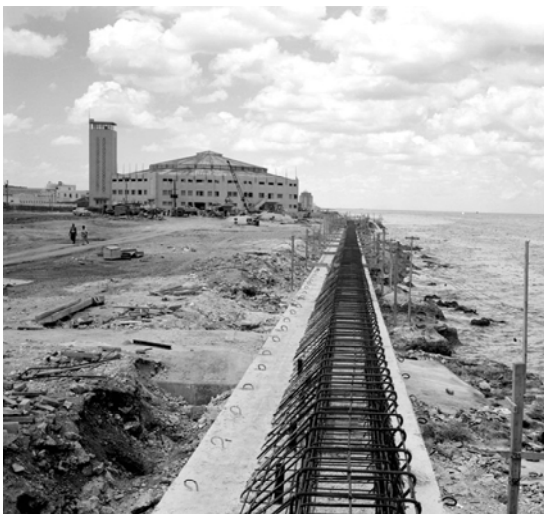
Ampliación de Malecón habanero década del 50

Hace ya 98 años, el 24 de junio de 1911, en Balcarce, Buenos Aires, Argentina nace Juan Manuel Fangio, un niño que llegó a convertirse en el mejor piloto de todos los tiempos. Joven que comenzó a trabajar en un taller de mecánica y en 1939 ganó "Los 1000 de Argentina". En 1950 Fangio compite en un auto Alfa Romeo y un año más tarde, triunfa en la Fórmula 1 categoría que mantiene desde 1954 hasta el año 1957. ¡Con cinco campeonatos mundiales!