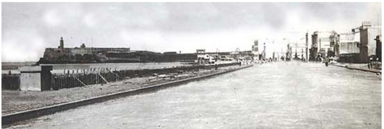
Ampliación de Malecón habanero

Muchos hombres de ciencia dedicaron sus vidas a la cimentación de este extenso banco, uno de ellos fue el destacado ingeniero cubano Don Francisco de Albear , hombre que “ideó” la obra en sus inicios. En esos años existían puntos defensivos (cañones) en el litoral del “ Monte vedado ”. El proyecto serviría para la recreación de los nuevos vecinos de la ciudad, aunque la escasa visión del gobierno no liberó los fondos y la intención de ampliación de Albear quedó en el olvido.