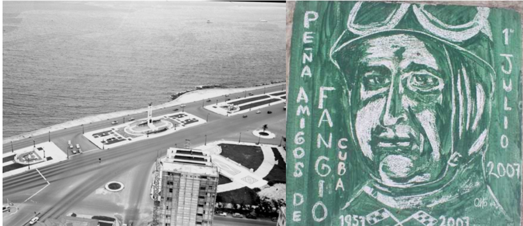
Monumento al Maine -1958- al frente el lugar donde esta hoy la Peña “Amigos de Fangio”