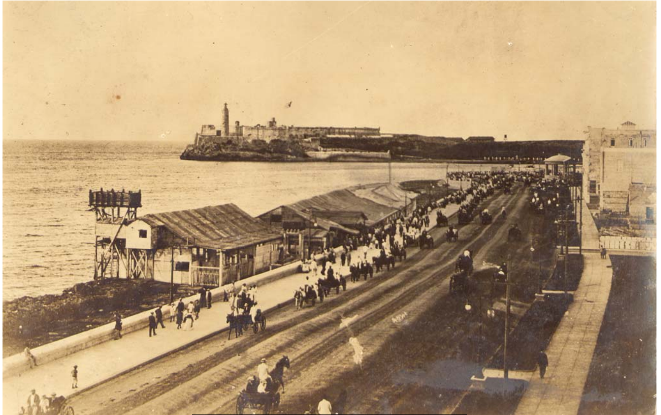
Malecón habanero, La Habana Colonial

Ya finalizando el siglo XIX, la Isla era la última colonia española en América, los productos americanos se apoderaban de La Habana. La ciudad era una urbe que demandaba cambios en su infraestructura por la necesidad de saneamiento lo que propició, entre otras cosas, el avance del Malecón... A mediados del siglo XIX, los ferrocarriles cobran vida por el crecimiento acelerado de la metrópoli. En 1859 comienzan a circular tranvías eléctricos desde el Puerto de La Habana a lo largo de la calle San Lázaro , pegado a la costa hasta la desembocadura del Río Almendares .