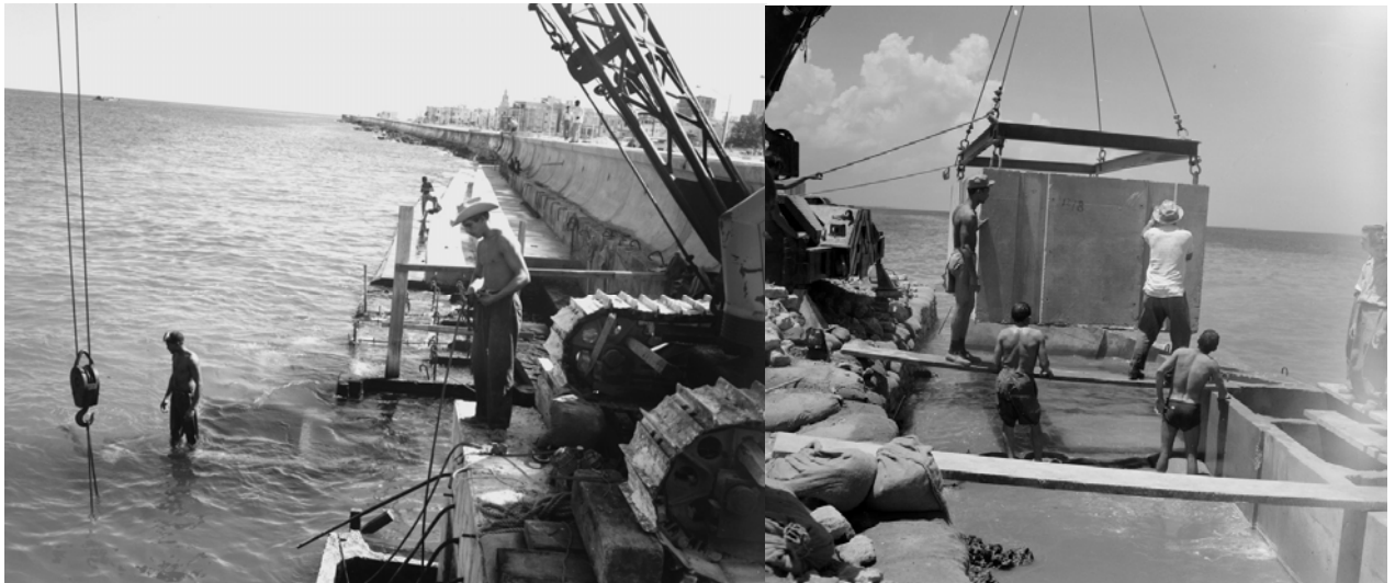
Ampliación de Malecón habanero década 50

Para dar una idea, en 1870 la ciudad de La Habana llegaba a la Calzada de Belascoaín y en el inicio de siglo XX el Malecón alcanzaba Infanta, ya en 1901 se decide construir el tramo entre el Paseo del Prado y la calle Crespo. Con el mandato de Gerardo Machado (1925-1933) el dique habanero, al igual que muchos lugares opulentos de La Habana, empezaron a florecer, concediéndoles más valor a la ciudad. Destacándose en las ampliaciones el Secretario de Obras Públicas Carlos Miguel de Céspedes y el urbanista Jean Forestier hombres que dirigieron parte de la edificación de la ciudad en ese período.