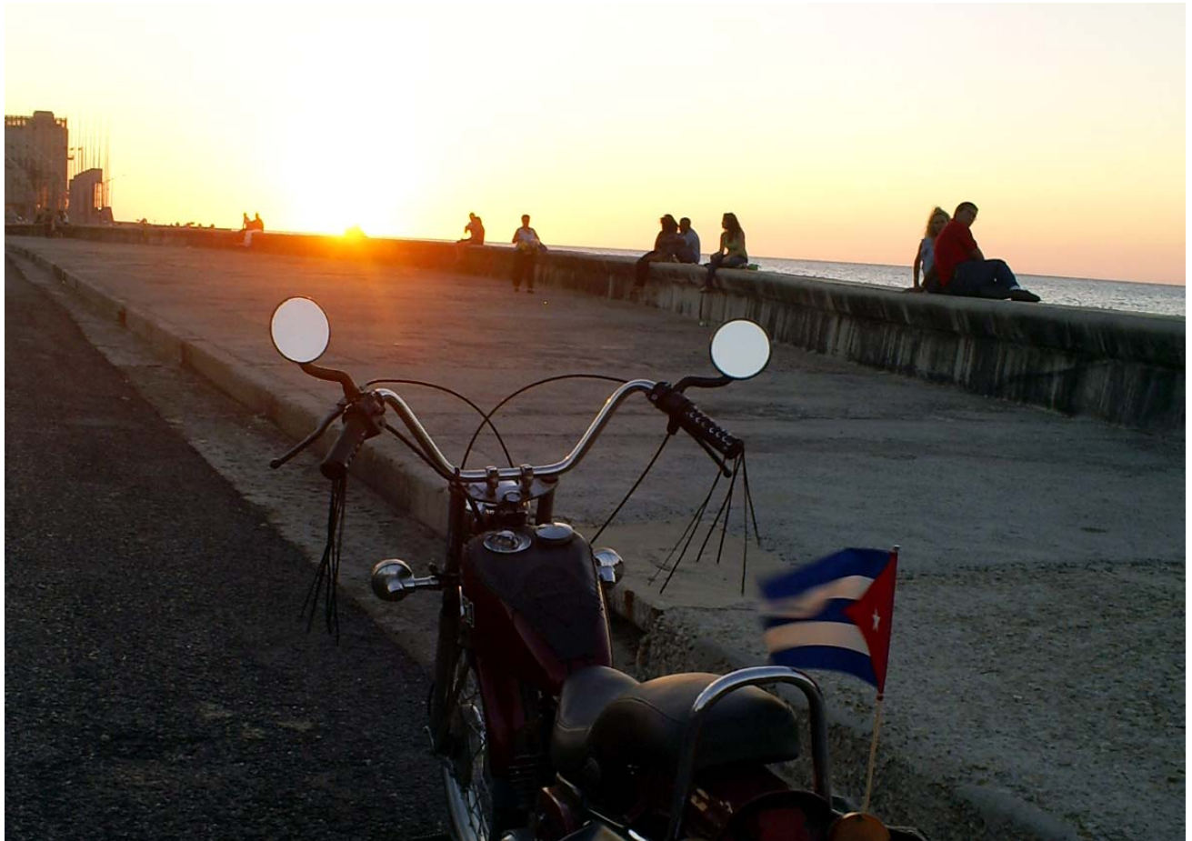
Malecón habanero 8 de mayo 2010

Agradezco a los anteriores fotógrafos para realizar este artículo