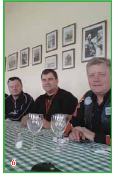
4. Sonur Che Guevara fær føroyska Merkið