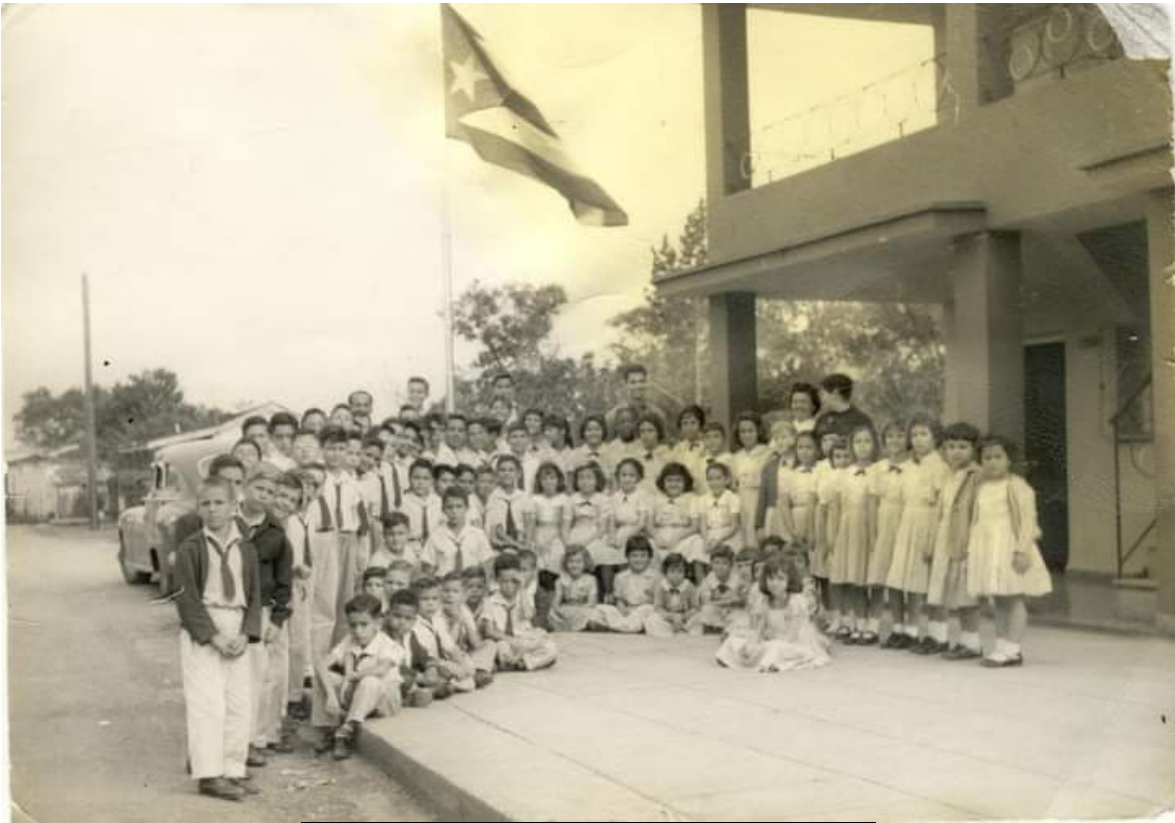
Academia Quesada escuela privada. Foto 3.