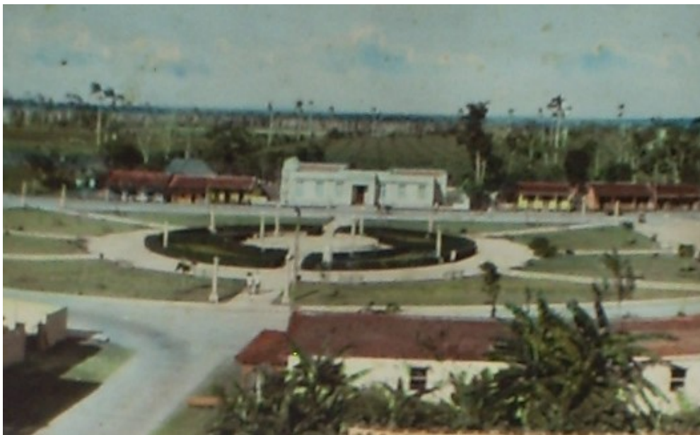
Escuela pública No. 29 en el fondo del parque de Wajay. Foto 1.

"Abogamos por la multiplicación del conocimiento, el rescate histórico, la imparcialidad y la veracidad". Hobbiesenred