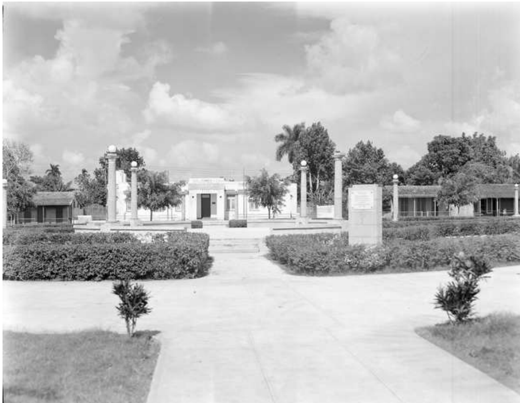
Parque Elisa Godínez. WAJAY. 1944, (Daniel Milián) Foto 4.