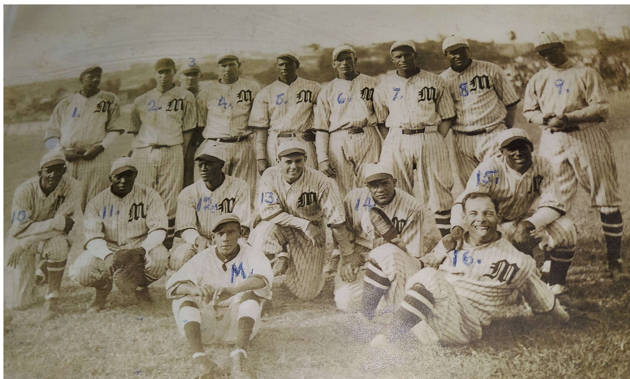
"Marianao" BBC Campeones de Cuba en 1922 - 1923. Foto 9.