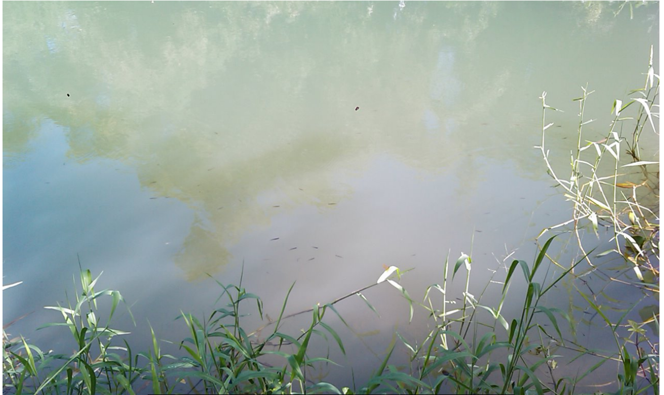
17 de noviembre 2013, río Almendares, La Habana, Cuba.

Los niveles de hierba invasora que poseen sus márgenes en el 2014 no es cuestión de meses, es cuestión de años de abandono, de permitir arrojar desechos peligrosos a sus márgenes, de levantar diques, de construir en sus laderas sin pensar que el río también merece respeto, limpieza, mantenimiento (dragado) y cuidado sistemático por las autoridades competentes “LEY DEL MEDIO AMBIENTE” (Ley No. 81) .