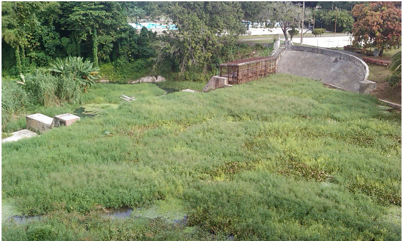
Forraje invasor, represa río Almendares, La Habana, Cuba 16/11/2013

“La prensa no es aprobación bondadosa o ira insultante; es proposición, estudio, examen y consejo”. José Martí