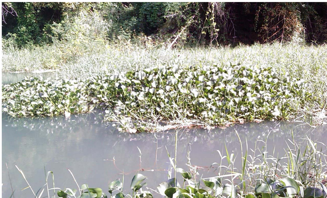
17 de noviembre 2013, río Almendares, La Habana, Cuba.

Solo la fuerza de la naturaleza ha posibilitado que en apenas un año, el Casiguagua comience a mostrar “ signos de recuperación ” en muchas de sus zonas contaminadas tramo desde: Calabazar, Río Verde, Río Cristal y el Puente de Hierro... debido a la incorporación en Calabazar de uno de sus tantos afluentes mutilados por la construcción de los embalses río arriba años atrás.