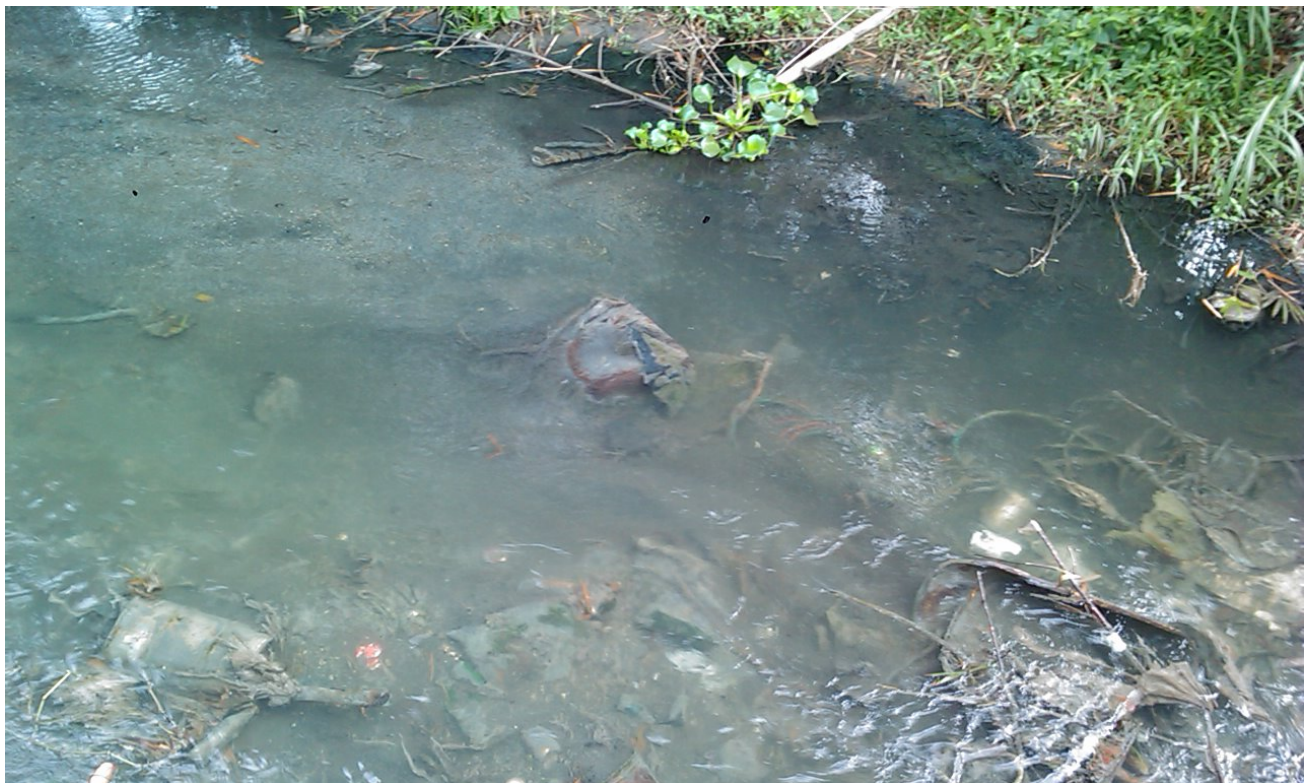
Antigua zona contaminada, puente autopista, Almendares, La Habana, Cuba 16/11/2013.

La recuperación será viable con el apoyo de las comunidades, vecinos, organizaciones ecologistas, jóvenes y la autoridad competente en los tramos por donde se desplaza el río ¡Y es que sólo hermanos es que podremos restablecer nuevamente la salud al Casiguagua!