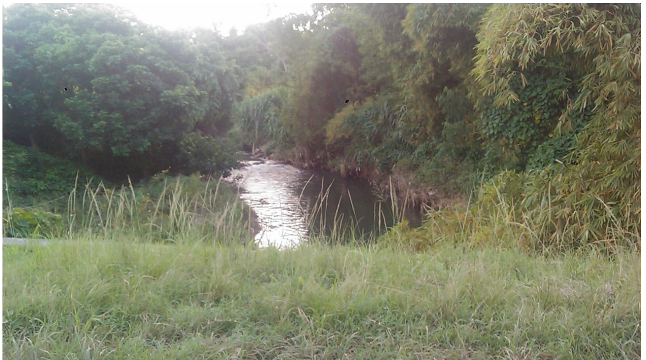
16 de noviembre 2013, río Almendares, La Habana, Cuba.

Los niveles de hierba invasora que poseen sus márgenes en el 2014 no es cuestión de meses, es cuestión de años de abandono, de permitir arrojar desechos peligrosos a sus márgenes, de levantar diques, de construir en sus laderas sin pensar que el río también merece respeto, limpieza, mantenimiento (dragado) y cuidado sistemático por las autoridades competentes “LEY DEL MEDIO AMBIENTE” (Ley No. 81) .