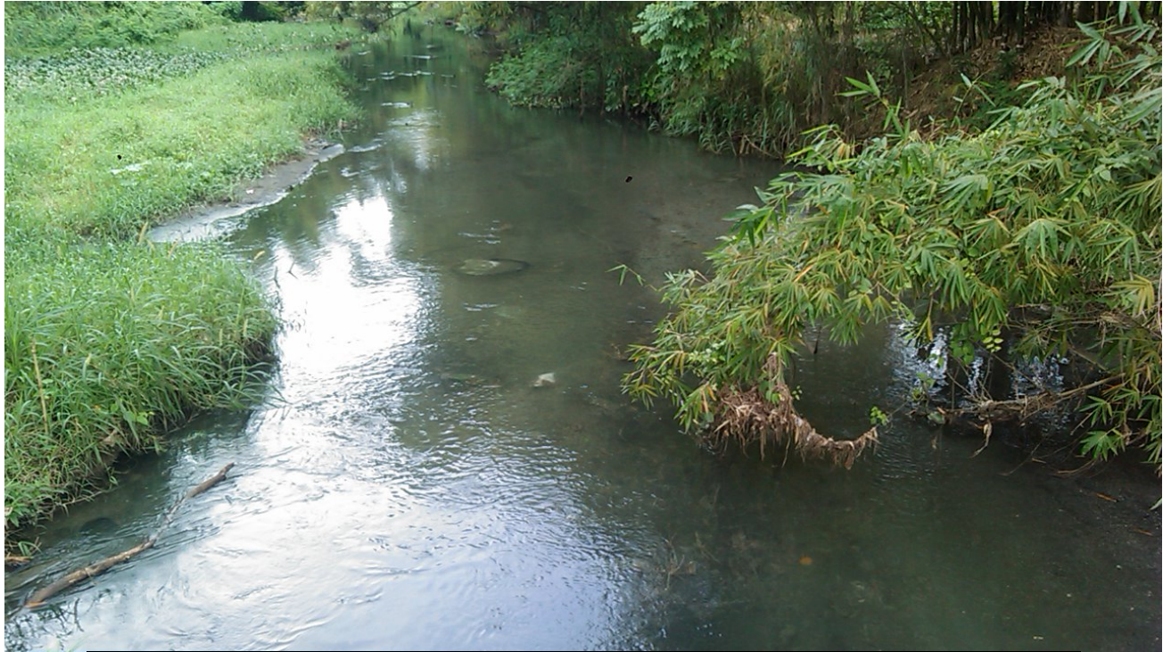
Antigua zona contaminada, puente autopista, Almendares, La Habana, Cuba 16/11/2013.

La recuperación será viable con el apoyo de las comunidades, vecinos, organizaciones ecologistas, jóvenes y la autoridad competente en los tramos por donde se desplaza el río ¡Y es que sólo hermanos es que podremos restablecer nuevamente la salud al Casiguagua!